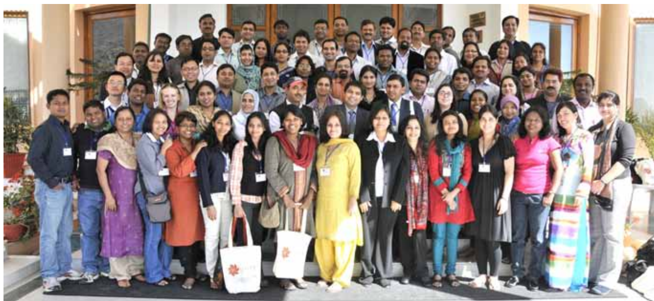
Reunión de ex becarios del IFP India, Jaipur, Rajastán, India, febrero 2010.

La estructura de la organización se definió conforme a las reglas y la normatividad vigentes para una asociación civil. Se creó una directiva y se eligió a los miembros que asumirían las responsabilidades de cada