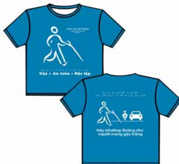
Camiseta diseñada por ex becarios vietnamitas para promover el Día del bastón blanco .

para promover el uso del bastón blanco 1 entre ese tipo de personas y para fomentar en la población en general la conciencia de ceder el paso a quienes caminan con bastón blanco . El 15 de octubre de 2011 este grupo de ex becarios colaboró con los medios locales, donantes y 50 personas con debilidad visual para llevar a cabo la primera celebración del Día Internacional del Bastón Blanco en el país, realizado en la Ciudad de Ho Chi Minh.