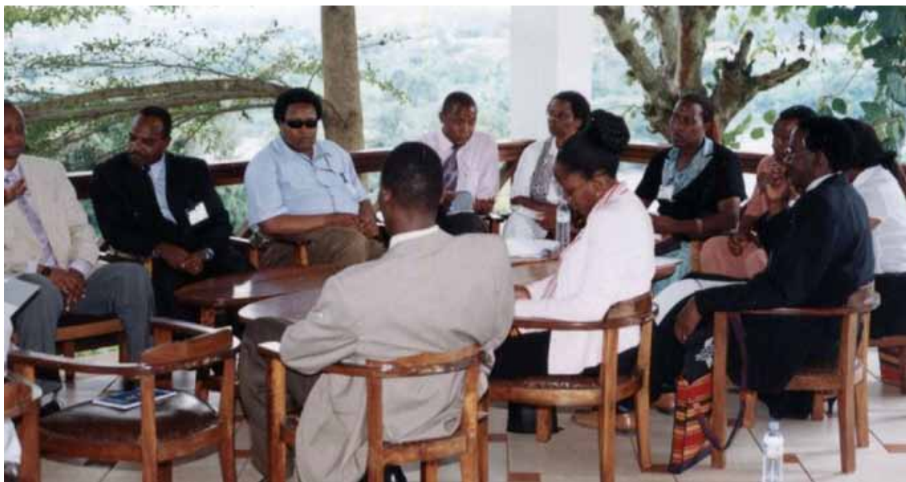
Ex becarios de Uganda, Kenia y Tanzania en la reunión de Jinja, Uganda, 2006.

Después de la reunión regional de ex becarios en 2006, la asociación ugandesa procedió a sentar las bases para la coordinación de sus actividades. Se concluyeron entonces los arreglos para contar con el espacio para una oficina dentro de AHEAD. Los miembros de la asociación acordaron que dicho espacio operaría como secretaría de la asociación y varios ex becarios se ofrecieron como voluntarios para administrar la oficina de manera rotativa. Se negoció un convenio de distribución de gastos con AHEAD a fin de cubrir los costos de los servicios públicos en los que se incurriera por operaciones. Asimismo, la oficina se convirtió en un centro de recursos y, además de ofrecer un espacio para reuniones y para los equipos de cómputo, incluyó una modesta colección de materiales de referencia considerados importantes para los intereses profesionales de los ex becarios.