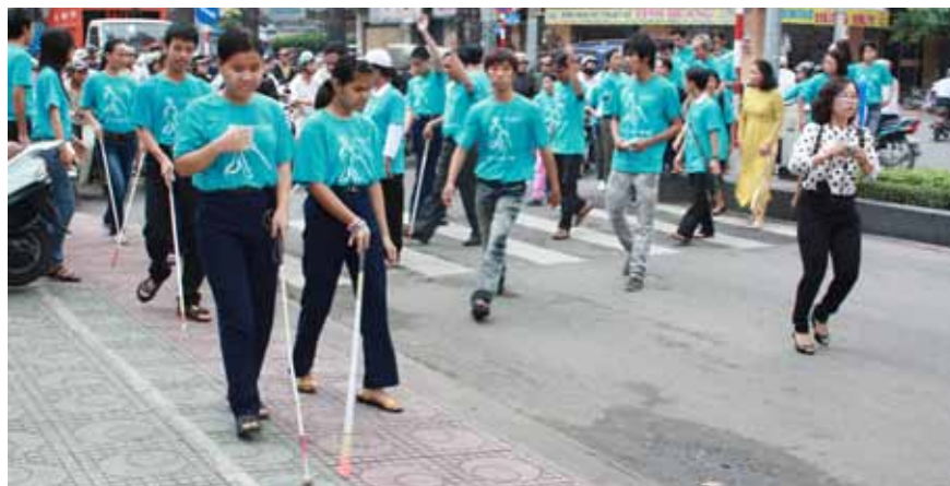
Primer Día Internacional del bastón blanco en la Ciudad de Ho Chi Minh, Vietnam, octubre 2011.