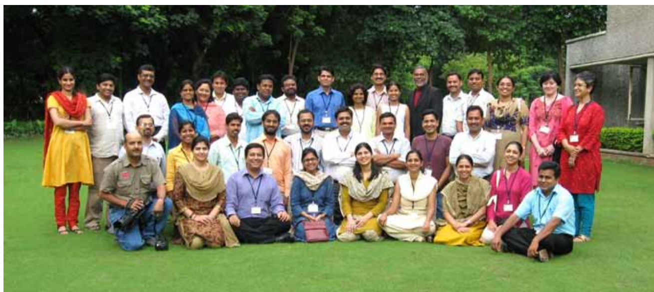
Reunión de ex becarios del IFP India, Anand, Gujarat, India, agosto 2008.

Con estas competencias, los ex becarios aquilatan y valoran sus mejoradas capacidades para dialogar y negociar con las estructuras del poder usando una voz recién descubierta; comprenden y aplican los conocimientos teóricos y las herramientas para sustentar su pasión por el cambio social; aportan organización y disciplina al trabajo por la justicia social, y mejoran su disposición de tolerancia hacia el Otro.