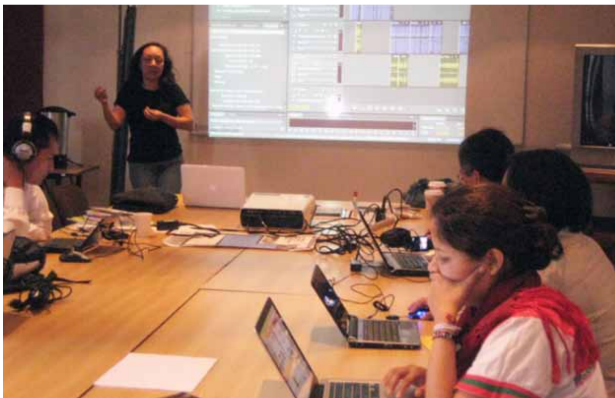
Ex becarios mexicanos en el Taller sobre radios comunitarias, Ciudad de México, México, octubre 2011.