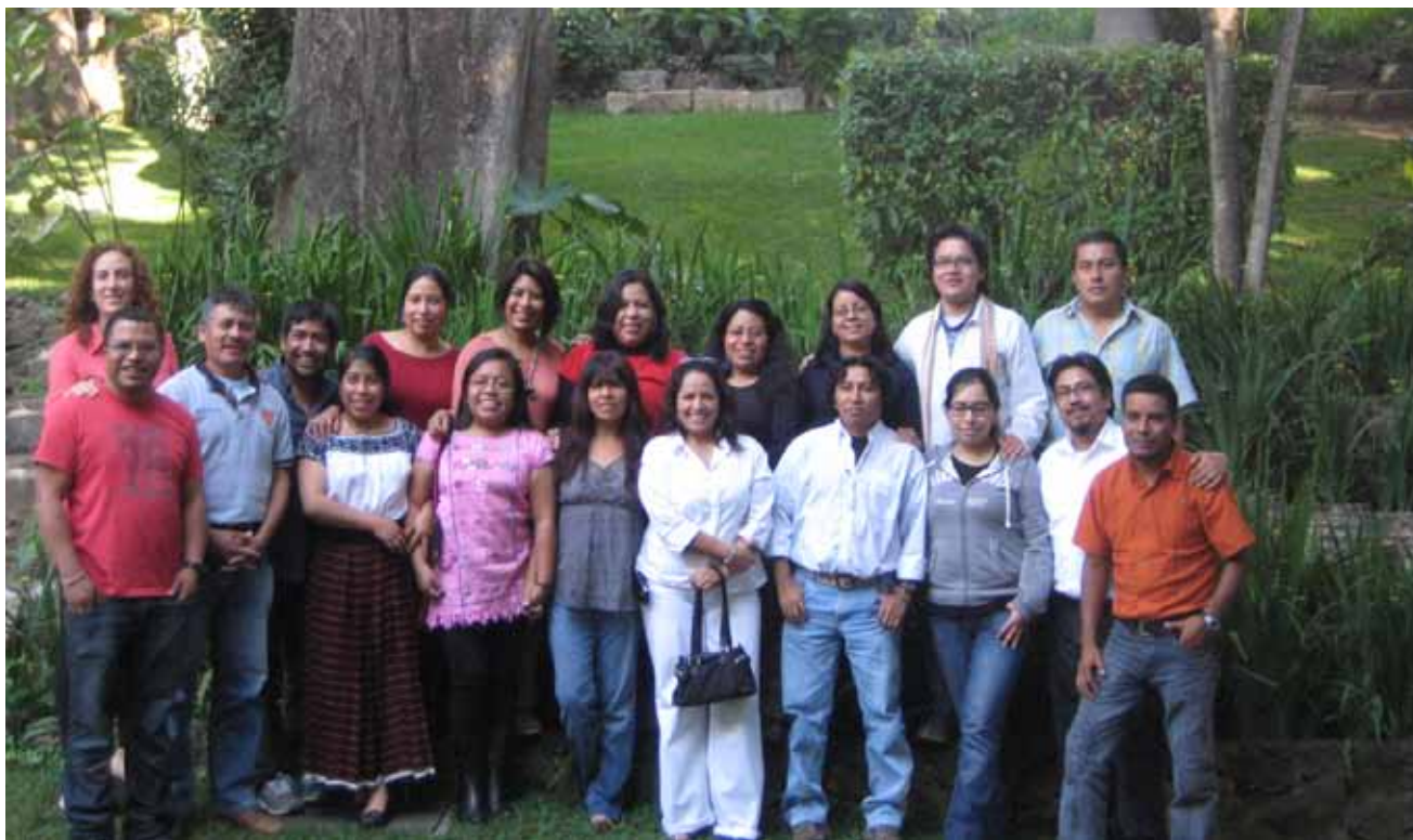
Ex becarios y personal de la Coordinación del IFP México en el taller de Reinserción Profesional, Cuernavaca, Morelos, México, diciembre 2011.

Un segundo reto que se ha enfrentado y que aquí destacamos, es la participación limitada en número de los ex becarios. Del total de ex becarios egresados a la fecha, se tiene comunicación constante con aproximadamente 40%. Entre otros efectos, esto dificulta la recuperación de información útil para evaluar el impacto del programa de manera exhaustiva. También se reduce la dimensión potencial del grupo de ex becarios integrado en redes de trabajo y que participan en la Red IINPIM. Sin pretender alcanzar una cobertura del 100%, sería deseable incrementar el porcentaje de quienes están en comunicación con el programa y aumentar así las potenciales colaboraciones con ellos y entre ellos mismos. Por otro lado, el grupo de ex becarios con el que se ha estado trabajando, que participan de manera sistemática en las actividades organizadas y responden a las solicitudes de información que periódicamente se les hacen llegar, es uno de los pilares para que se haya avanzado de manera importante en la consecución de las metas y propósitos generales de la fase postbeca.