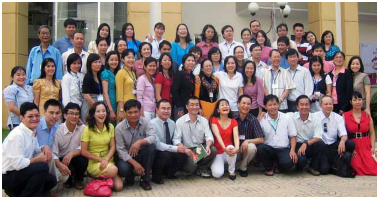
Reunión de ex becarios del IFP Vietnam en la Ciudad de Ho Chi Minh, Vietnam, noviembre 2010.

En algún momento los ex becarios vietnamitas consideraron la posibilidad de registrarse como organización no gubernamental independiente a fin de incrementar su visibilidad y elegibilidad como grupo de profesionales dispuestos a brindar sus conocimientos y habilidades profesionales colectivas a las comunidades. Sin embargo, dicho registro les exigía tener una