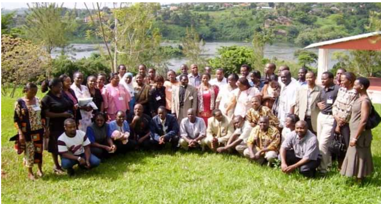
Ex becarios de Kenia, Uganda y Tanzania en la reunión de ex becarios de África Oriental en Jinja, Uganda, 2006.

En la parte occidental del país la asociación se encarga de moldear las actitudes hacia las prácticas del buen gobierno. Los trabajos de la asociación se concentrarán en el análisis de la eficacia de los servicios en un sistema descentralizado. La lucha contra los malos manejos de los recursos públicos será la clave de la intervención del colectivo en la zona central del país, particularmente en los distritos de Kampala y Mukono. La asociación planea ampliar el acceso a la justicia y la participación comunitaria en la impartición de justicia en el este de Uganda. Para ello, se han considerado las siguientes estrategias: